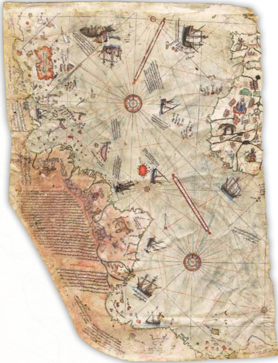
Piri Reis'in 1513 yılında çizdiği haritanın, uzaydan çekilen dünya fotoğraflarıyla birebir aynı olmasının hâlâ bir izahı yok.

Osmanlı coğrafyacıları arasında dünyada en çok tanınan ve Türk denizcilik tarihi denildiğinde akla gelen ilk isimlerden olan Piri Reis, bu yıl bütün dünyada anılıyor. Piri Reis'i dünyaya tanıtan en büyük özelliği, elbette ki bir haritacı olması. Gerek “Kitâb-ı Bahriye”sinde yer alan çizimler, gerekse 1513 ve 1528 yıllarında tamamladığı iki adet dünya haritası, günümüzde dünya mirası olarak anılıyor. Birleşmiş Milletler Eğitim Bilim ve Kültür Kurumu (UNESCO), 2013 yılını, Piri Reis'e ait dünya haritasının 500'üncü yıldönümünü “Anma Yılı” olarak ilan etti. Piri Reis'in, Ege ve Akdeniz kıyıları, limanlarını ve yerleşim yerlerini tasvir ettiği “Kitâb-ı Bahriye”si, denizcilik ve haritacılık tarihi başta olmak üzere birçok değişik birimin önde gelen kaynak kitabı ve eseri. Bu ilk ve önemli denizcilik kitabının yanı sıra, 1513 ve 1528 yıllarında tamamladığı iki adet dünya haritası, kartografya (harita yapım bilimi, sanatı ve teknolojisi) tarihimizin en önemli parçaları olarak niteleniyor. Özellikle Afrika ve Avrupa kıtalarının batı kıyıları ile Atlas Okyanusu'nu ve Amerika kıtasının doğu kıyıları (kısmi olarak) gösteren 1513 tarihli ilk haritası, dünya bilim tarihinin en kıymetli miraslarından ve bilinen en eski 'dünya haritası' olarak ta-