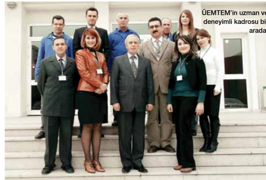
ÜEMTEM'in uzman ve deneyimli kadrosu bir arada.

Birçok işletme eleman alırken Merkezimizde eğitim görenlere öncelik tanımaktadır. Ayrıca eleman ihtiyaçlarını da bize bildirmektedirler. ÜEMTEM olarak açtığımız günden 31 Aralık 2012 tarihine kadar toplam 177 bin 268 kişiye eğitim verdik. Her geçen gün artan bir talep var. Bu da gösteriyor ki; geçen zaman içinde yaptıklarımız bize önemli bir isim ve nüfuz kazandırmış.