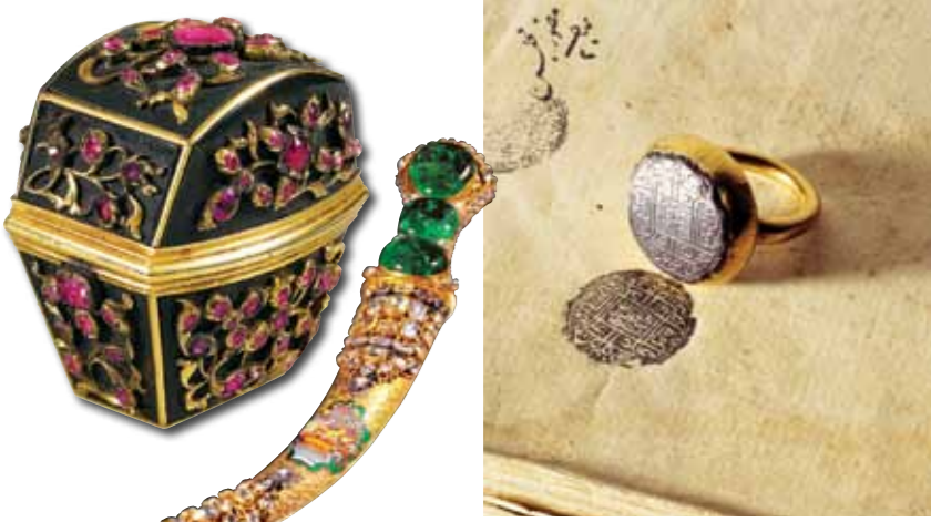
III. Selim'in mücevherli tesbihi ve 18'inci yüzyıla ait türlü mücevherlerle bezenmiş yüzük kutusu ile zümrütlü mineli bir hançer, Osmanlı'nın mücevher kullanımı hakkında bize ipuçları veriyor.