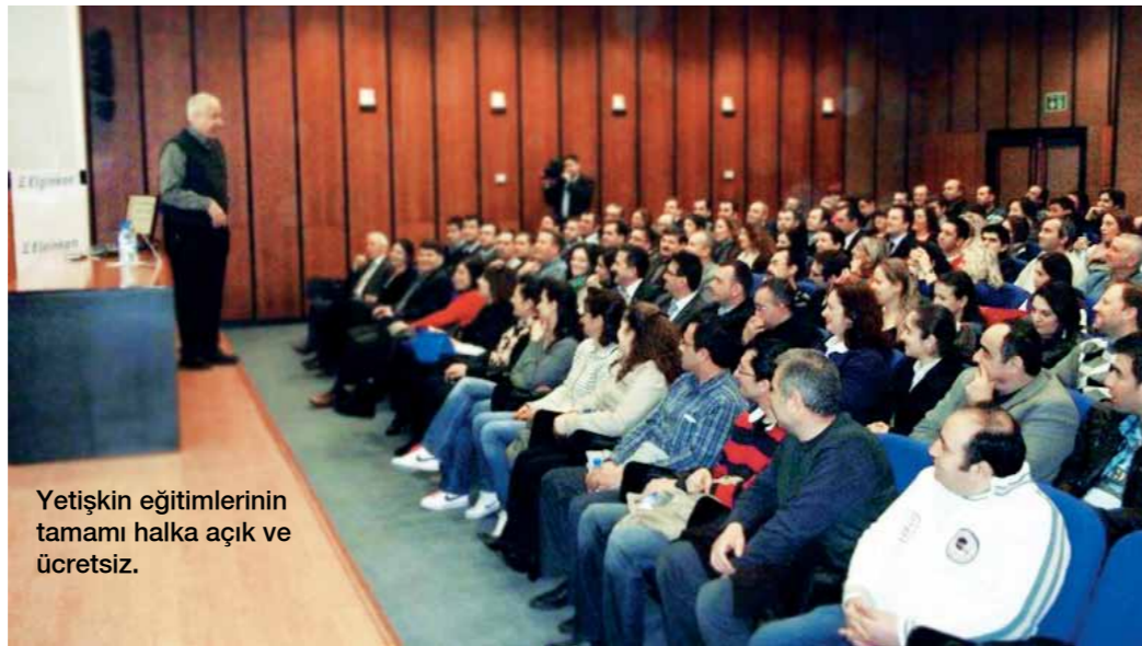
Yetişkin eğitimlerinin tamamı halka açık ve ücretsiz.