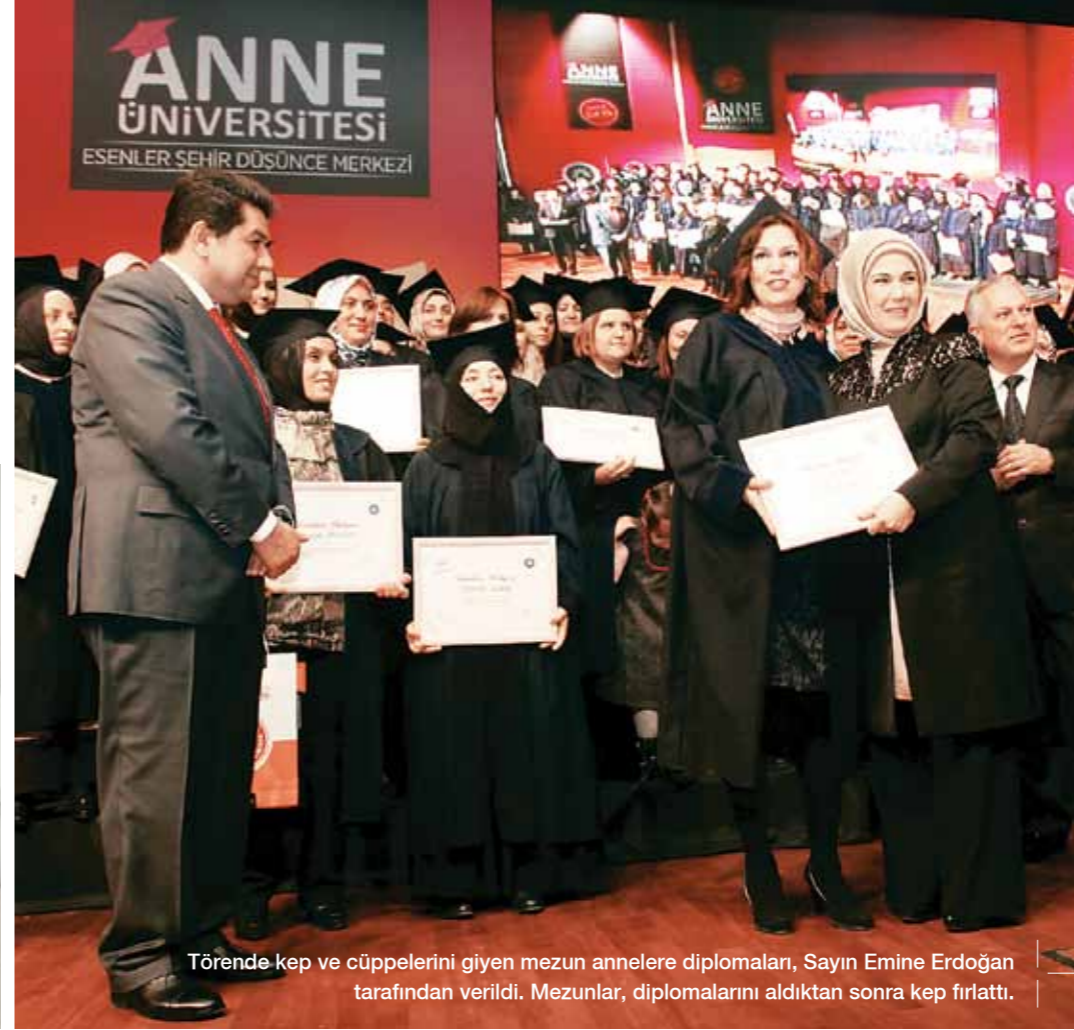
Törende kep ve cüppelerini giyen mezun annelere diplomaları, Sayın Emine Erdoğan tarafından verildi. Mezunlar, diplomalarını aldıktan sonra kep fırlattı.

Katılan annelerin arasında küçük çocukları olanlar da vardı, ergenlik çağında çocuğu olanlar da... Hatta bir ergen çocuğu bir de daha küçücük çocuğu olan anneler vardı. Bağlantı noktası ise suydur: Bebekliğinde ve çocukluğunda çocuğumuzla ilişkilerimizi sağlam tutabilirsek ve mümkün merteye onu olduğu gibi kabul etmeyi başararsak ergenlik döneminde işler daha rahat yürüyebiliyor. Tabii ki bunun da garantisi yok ama aile içinde iyi ilişkiler kuran, sevgi ve saygı gören bir ergen, dışarıda kendisi için tehlike yaratabilecek şeylere pek yönelmiyor. Ergenlik dönemi oldukça ilgi çekiciydi anneler açısından, bir de okul öncesi dönemi onların çok dikkatini çekti. Çünkü bu evrede çocuklar hayalle gerçeği karıştırabiliyorlar, cansız varlığa canlıymış gibi davranabiliyorlar. Bisikletine at muamelesi yapan çocuklar, oyuncak bebeği düştü diye oturup ağlayanlar... Bu dönem de oldukça ilgi çekici, o yüzden bu konular üzerinde yoğunlaştık.